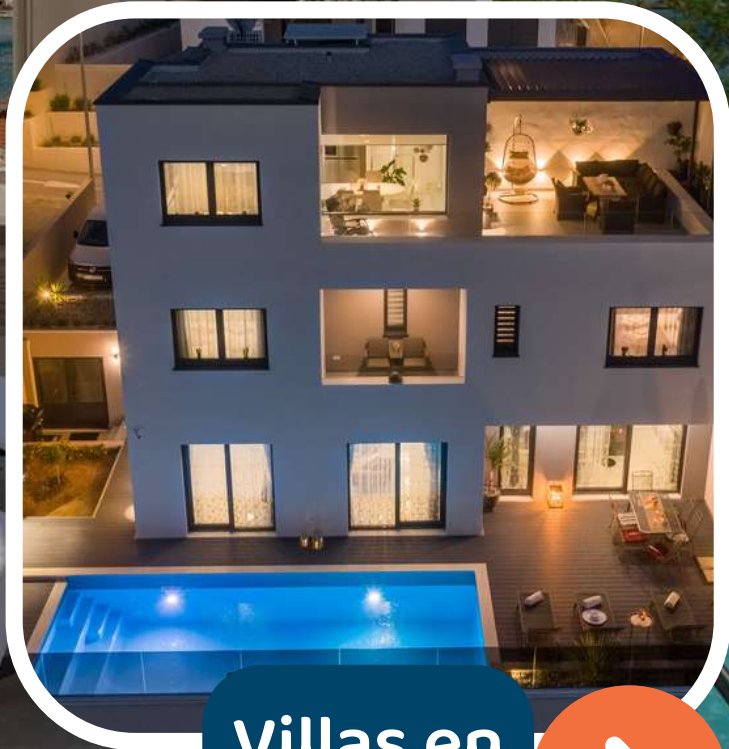
Villas en Croatie