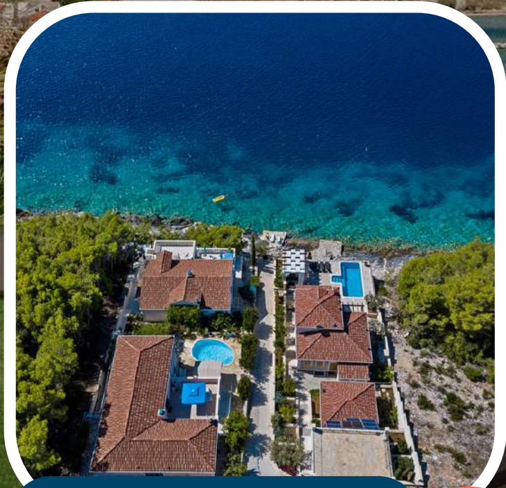
Hébergement en bord de mer