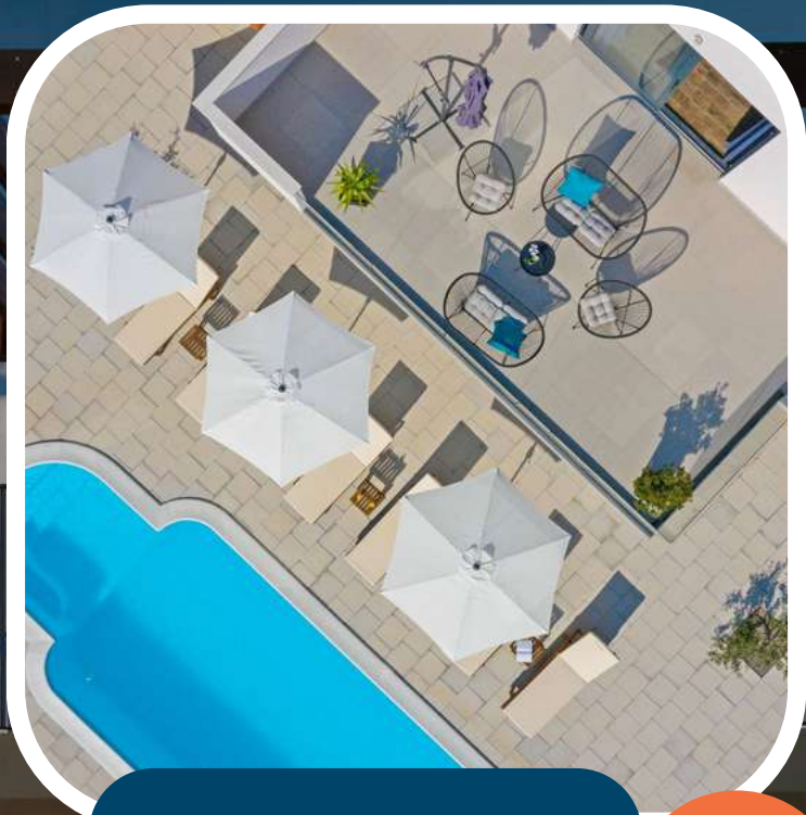
Hébergement avec piscine